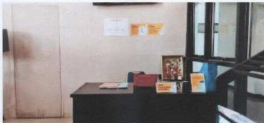
Gambar 1. Meja Pelayanan Informasi