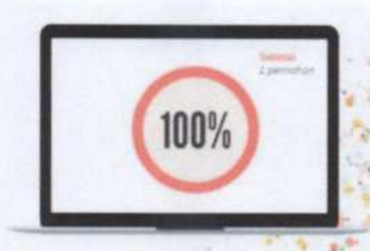
Gambar 6. Permohonan informasi yang dikabulkan

Sepanjang tahun 2023, satu permohonan Informasi Publik yang diterima PPID Pelaksana Dinas Koperasi Usaha Kecil dan Menengah Provinsi Kep Bangka Belitung telah diproses dan diselesaikan dengan baik.