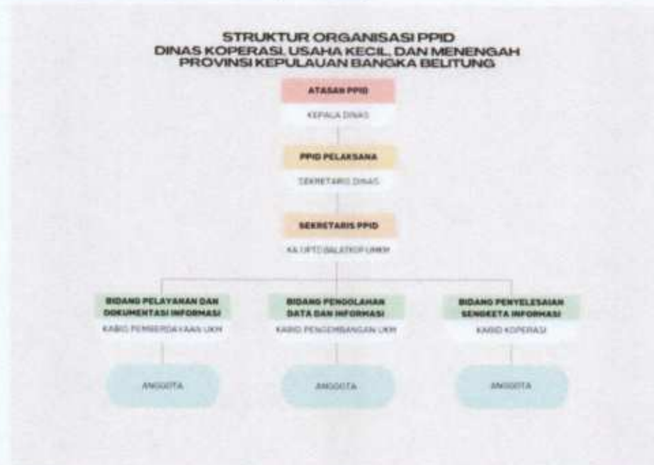
Gambar 5. Struktur Organisasi

Secara operasional PPID Pelaksana Dinas Koperasi Usaha Kecil dan Menengah Provinsi Kep Bangka Belitung didukung oleh SDM yang beranggotakan dari Pejabat Struktural dan Staf/Fungsional sesuai dengan struktur organisasi yang telah ditetapkan (sesuai dengan Surat Keputusan Kepala Dinas).