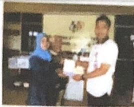
Foto Kegiatan Penyusunan Bibliografi Induk Daerah dan Katalog Induk Daerah

1.1.2 Kegiatan Pelestarian dan Pengelolaan Bahan Pustaka oleh Dinas Kearsipan dan Perpustakaan Provinsi Kepulauan Bangka Belitung dengan alokasi anggaran sebesar Rp. 9.650.000,00 realisasi anggaran sebesar Rp 5.359.000,00 atau 55,84%. Keluaran kegiatan adalah terkelolanya dan terpeliharanya bahan pustaka, sebanyak 430 bahan pustaka.