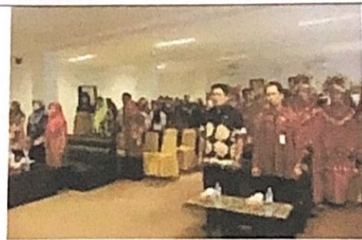
Foto Kegiatan Pengembangan Minat dan Budaya Baca