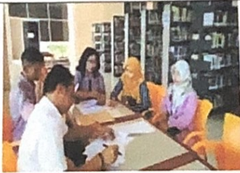
Foto penyusunan profil perpustakaan se-Prov. Kep. Babel

1.2.2 Kegiatan Penyusunan profil perpustakaan se-provinsi kep. Bangka belitung oleh Dinas Kearsipan dan Perpustakaan Provinsi Kepulauan Bangka Belitung dengan alokasi anggaran sebesar Rp. 35.680.000,00 realisasi anggaran sebesar Rp. 30.019.750,00 atau 84,14%. Keluaran kegiatan ini adalah jumlah jumlah dokumen sebanyak 1 dokumen yang datanya di entry dalam aplikasi.