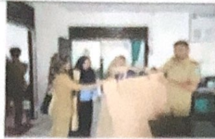
Foto Kegiatan Arsip Masuk Desa

3.1.2 Kegiatan Arsip Masuk Desa oleh Dinas Kearsipan dan Perpustakaan Provinsi Kepulauan Bangka Belitung dengan alokasi anggaran sebesar Rp. 17.130.000,00 realisasi anggaran sebesar Rp. 12.585.000,00 atau 73,47%. Keluaran kegiatan ini adalah sebanyak 25 desa/kelurahan yang mendapat layanan sadar arsip.