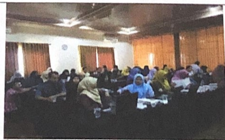
Foto Kegiatan Penerapan E-Arsip di Prov. Kep. Babel

1.1.1 Kegiatan Penerapan E-Arsip oleh Dinas Kearsipan dan Perpustakaan Provinsi Kepulauan Bangka Belitung dengan alokasi anggaran sebesar Rp. 111.042.000,00 realisasi anggaran sebesar Rp. 94.036.500,00 atau 84,69%. Keluaran kegiatan ini adalah OPD yang mengikuti bimtek e-arsip.