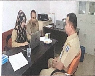
Foto Kegiatan Pengawasan Kearsipan Di Pemerintah Prov. Kep. Babel

3.1.3 Kegiatan Pengawasan Kearsipan di Pemerintah Provinsi Kepulauan Bangka Belitung oleh Dinas Kearsipan dan Perpustakaan Provinsi Kepulauan Bangka Belitung dengan alokasi anggaran sebesar Rp. 38.750.000,00 realisasi anggaran sebesar Rp. 1.213.900,00 atau 3,13%. Keluaran kegiatan adalah sebanyak 4 perangkat daerah yang mendapat pengawasan kearsipan.