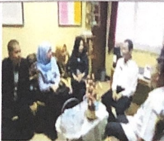
Foto Kegiatan Akreditasi Perpustakaan

1.2.3 Kegiatan Akreditasi Perpustakaan oleh Dinas Kearsipan dan Perpustakaan Provinsi Kepulauan Bangka Belitung dengan alokasi anggaran sebesar Rp. 933.989.850,00 realisasi anggaran sebesar Rp. 18.809.750,00 atau 55,34%. Keluaran kegiatan ini adalah jumlah perpustakaan sekolah yang sudah terakreditasi, sebanyak 4 perpustakaan.