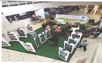
Foto Kegiatan Pameran Arsip Statis Pemerintah di Prov. Kep. Babel

3.2.2 Kegiatan Pameran Arsip Statis Pemerintah Provinsi Kepulauan Bangka Belitung oleh Dinas Kearsipan dan Perpustakaan Provinsi Kepulauan Bangka Belitung dengan alokasi anggaran sebesar Rp. 81.150.000,00 realisasi anggaran sebesar Rp. 74.499.500,00 atau 91,80%. Keluaran kegiatan ini adalah sebanyak 1.017 orang pengunjung pameran arsip statis.