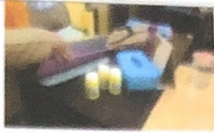
Foto Kegiatan Pemeliharaan Rutin/Berkala Arsip Daerah

3.2.2 Kegiatan Pameran Arsip Statis Pemerintah Provinsi Kepulauan Bangka Belitung oleh Dinas Kearsipan dan Perpustakaan Provinsi Kepulauan Bangka Belitung dengan alokasi anggaran sebesar Rp. 81.150.000,00 realisasi anggaran sebesar Rp. 74.499.500,00 atau 91,80%. Keluaran kegiatan ini adalah sebanyak 1.017 orang pengunjung pameran arsip statis.