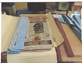
Foto Kegiatan Pelestarian dan Pengelolaan Bahan Pustaka

1.1.2 Kegiatan Pelestarian dan Pengelolaan Bahan Pustaka oleh Dinas Kearsipan dan Perpustakaan Provinsi Kepulauan Bangka Belitung dengan alokasi anggaran sebesar Rp. 9.650.000,00 realisasi anggaran sebesar Rp 5.359.000,00 atau 55,84%. Keluaran kegiatan adalah terkelolanya dan terpeliharanya bahan pustaka, sebanyak 430 bahan pustaka.