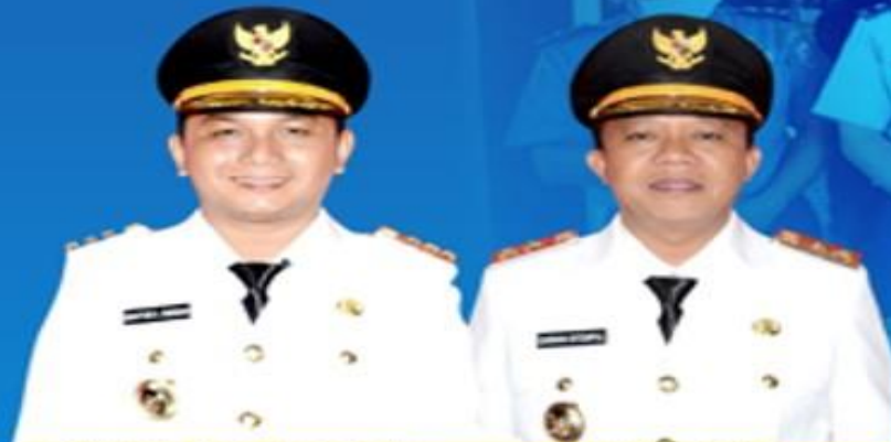
BAKHTIAR AHMAD SIBARANI BUPATI TAPANULI TENGAH

UPDATE DATA PASIEN PADA TANGGAL 30 MEI 2020