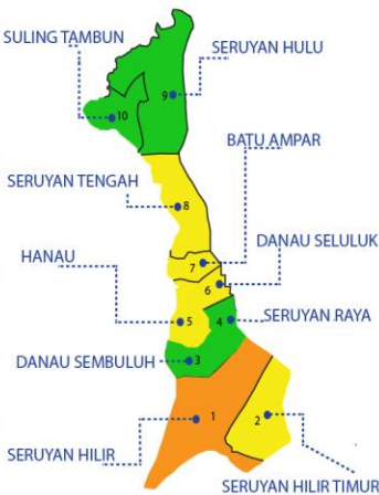
Keterangan warna Peta