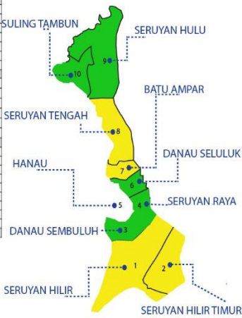
Keterangan warna Peta