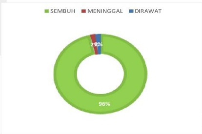
PERSENTASE KONDISI PASIEN COVID-19 KABUPATEN SERUYAN