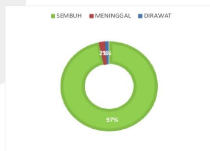
PERSENTASE KONDISI PASIEN COVID-19 KABUPATEN SERUYAN