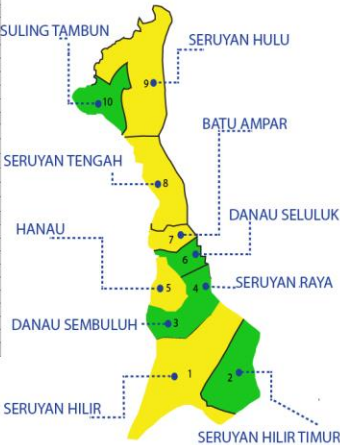
Keterangan warna Peta