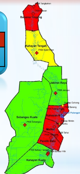
Peta Zona Sebaran Kasus Covid – 19 Di Kabupaten Pulang Pisau Dari Tanggal 17 Maret s/d 23 April 2020