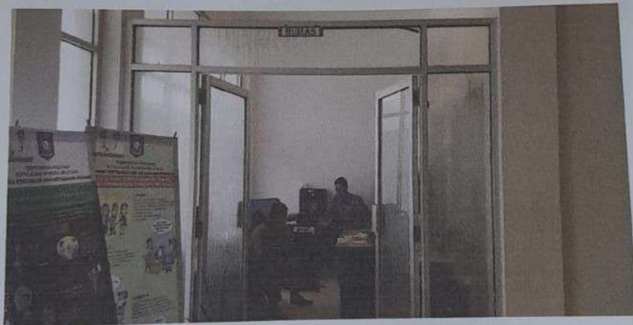
Gambar 1. Ruang layanan tampak dari luar