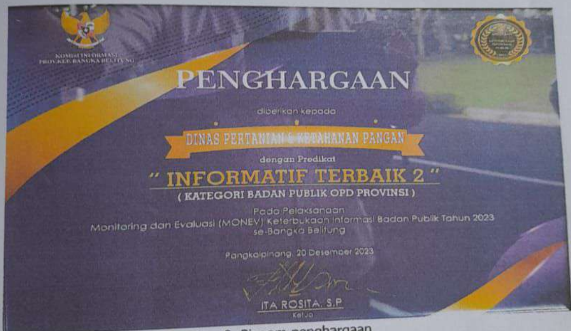
Gambar 8. Piagam penghargaan

Sepanjang Tahun 2023, PPID Pelaksana Dinas Pertanian dan Ketahanan Pangan Provinsi Kepulauan Bangka Belitung mencatatkan banyak kemajuan. Salah satu diantaranya adalah meraih Penghargaan Badan Publik Informatif Terbaik ke – 2 Tahun 2023 untuk Kategori Organisasi Perangkat Daerah di Lingkungan Pemerintah Provinsi Kepulauan Bangka Belitung. Selain itu PPID Pelaksana Dinas Pertanian dan Ketahanan Pangan disediakan ruang pelayanan yang representatif dilengkapi dengan sejumlah fasilitas pendukung untuk memberikan kenyamanan dan kemudahan bagi publik yang mengajukan permohonan informasi.