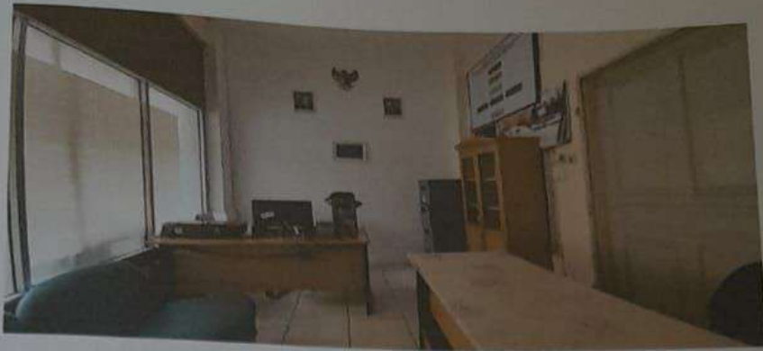
Gambar 2. Ruang layanan beserta fasilitas pendukung