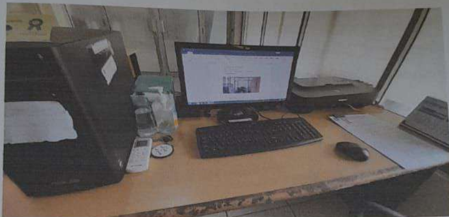
Gambar 3. Fasilitas pendukung ruang layanan PPID

Terkait dengan penyampaian informasi dan program, PPID Pembantu Dinas Pertanian dan Ketahanan Pangan Provinsi Kepulauan Bangka Belitung terhubung dengan Website PPID Utama yang terkoneksi langsung dengan Website Dinas Pertanian dan Ketahanan Pangan Provinsi Kepulauan Bangka Belitung.