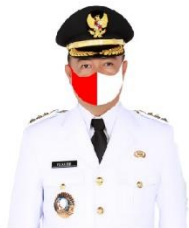
YULHAIDIR Bupati Seruyan Sekeloa Satgas Gugus Tugas Penanganan Covid-19 Kabupaten Seruyan