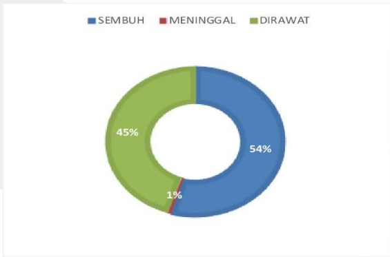
PERSENTASE KONDISI PASIEN COVID-19 KABUPATEN SERUYAN

sumber data : Media Center Satuan Tugas Seruyan