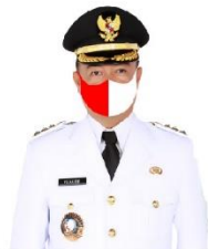
YULHAIDER Bupati Seruyan Sebelum Ketua Gugus Tugas Penanganan Covid-19 Kabupaten Seruyan