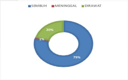
PERSENTASE KONDISI PASIEN COVID-19 KABUPATEN SERUYAN