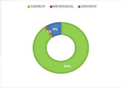
PERSENTASE KONDISI PASIEN COVID-19 KABUPATEN SERUYAN