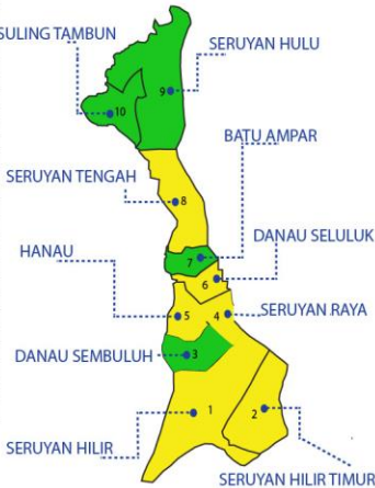
Keterangan warna Peta