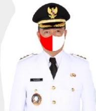
YULHAIDIR Bupati Seruyan Setaku Ribaa Gugus Tugas Penanganan Covid-19 Kabupaten Seruyan