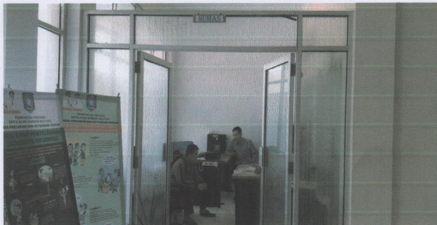
Gambar 1. Ruang Layanan

Terkait dengan penyampaian informasi dan program, PPID Pembantu Dinas Pertanian dan Ketahanan Pangan Provinsi